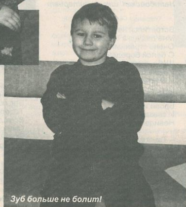
Зуб больше не болит!

Зубная щётка. Она должна «расти» вместе с вами. Обычно её рабочая