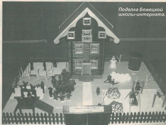
Поделка Бежецкой школы-интерната.

— И в мешке загадочном Что ты нам принёс? Отвечает дедушка, Как зима седой, Отвечает дедушка С белой бородой: