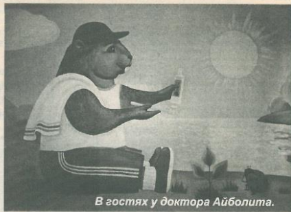
В гостях у доктора Айболита.