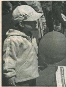
«Планета детства» – так был назван весёлый, шумный праздник, посвящённый Международному дню защиты детей. В Парке Победы по инициативе администрации

губернатора Тверской области собралось множество мальчишек и девчонок интернатных учреждений, социально-реабилитационных центров г. Твери и области, детей-инвалидов. Позади был длинный учебный год, впереди – длинные летние каникулы. Самое подходящее настроение для того, чтобы прозвучать по «Планете детства». Как и другие ребята, наши юные корреспонденты участвовали в различных конкурсах, посмотрели концерт детских и юношеских коллективов города, сходили на спектакль в «Театр кукол». Но всё это время их беспокойные умы не покидал вопрос: «От кого и от чего нужно детей защищать?» С привычной решительностью или, наоборот, переступая через своё стеснение, они на несколько минут прерывали отдых больших