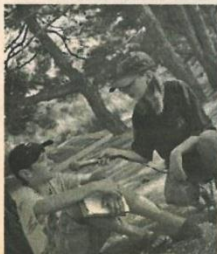
Интервью телеведущих «Окна» (г. Сергиев Посад)