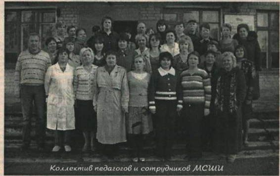
Коллектив педагогов и сотрудников МСШИ