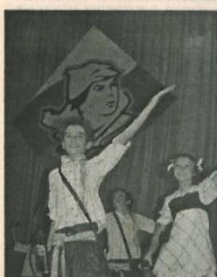
Поют «Волшебники двора» (г. Москва)