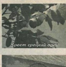
Зреет грецкий орех