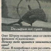
Дельфин на сучье