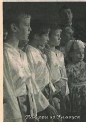
Танцоры из Эммануэля