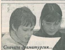
Сначала о драматургии...