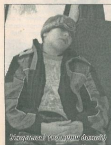
Уточняет (по пути домой)

На мастер-классе с командами занимались педагогами Московского института открытого образования (МИОО). Постепенно ребята и взрослые привыкли к их стилю, к их шуткам и трюкам. Предлагаем читателям несколько блиц-интервью.