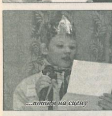
...потом на сцену