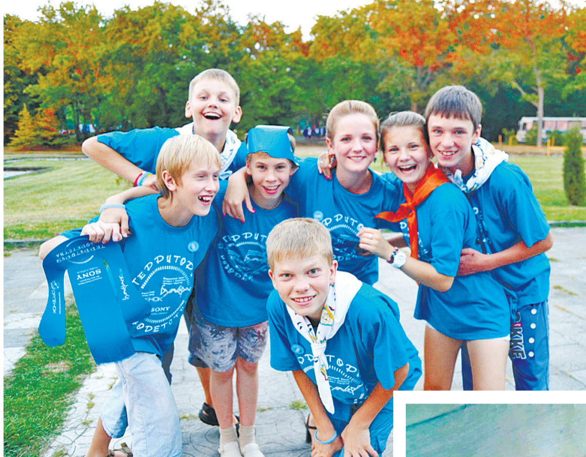
ВСЕ ВМЕСТЕ МЫ – РОССИЯ!

Каждое утро в лагере начиналось с зарядки. Для воспитанни-