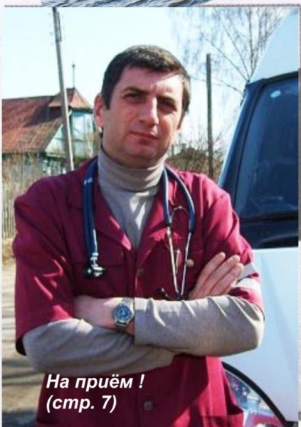
На приём! (стр. 7)