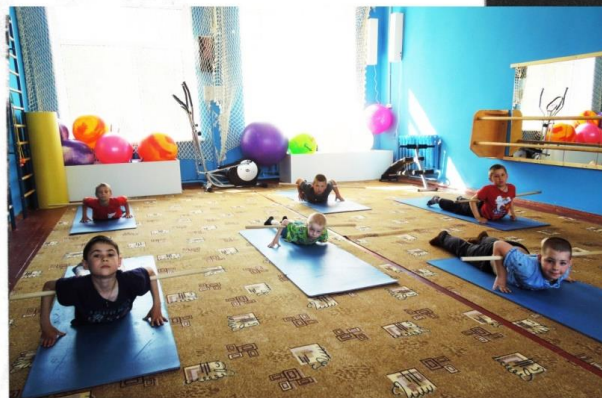
Младшая группа на ЛФК

- Срок пребывания детей в школе-интернате зависит от медицинских показаний, семейных и бытовых условий. Минимальный курс лечения – три месяца. Конкретные сроки устанавливаются врачом-специалистом. В мае каждого года в учреждении работает выездная комиссия врачей-фтизиатров детского отделения Областного противотуберкулёзного диспансера, которая производит выписку детей, закончивших