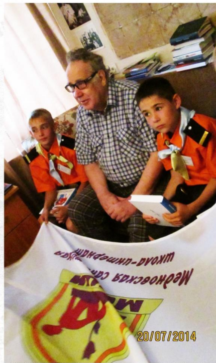
В гостях у любимого писателя.

Помимо тренировочных ходок под парусами учились фехтованию, морскому делу, знакомились с вооружением, проходили огневую подготовку, изучали астрономию, пели песни и участвовали в викторине и театральном вечере, посвящённым произведениям Крапивина. «Под занавес» был бал, к которому готовились с перво-