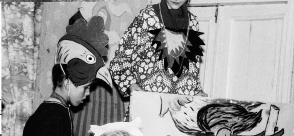
Приглашение в ска... (стр. 3)