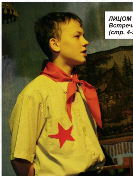
ЛИЦОМ К ЛИЦУ: Встреча с Героем (стр. 4-5)