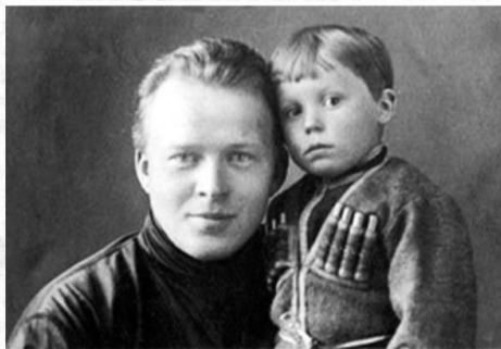
А. Гайдар с сыном Тимуром