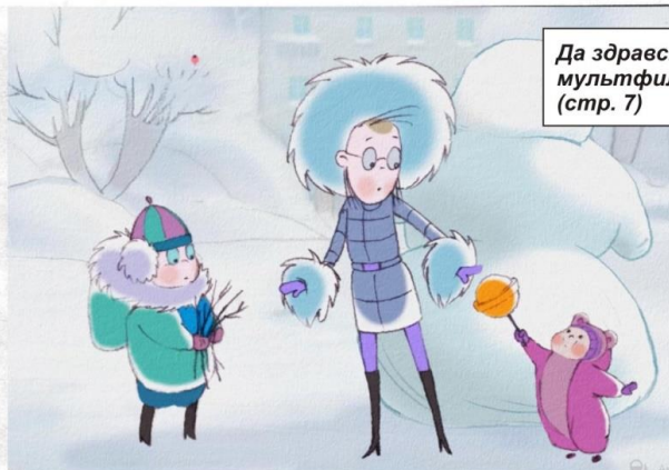
Да здравствует мультфильм! (стр. 7)