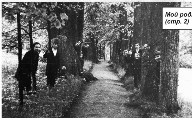
Мой родной дом (стр. 2)