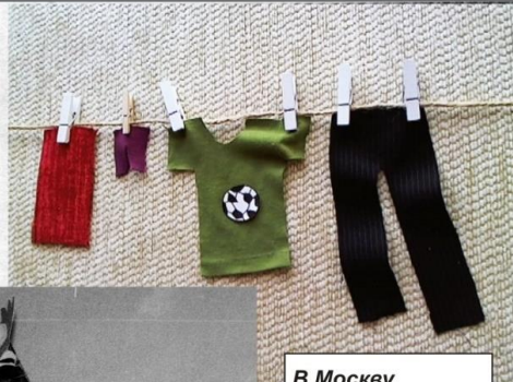
В Москве на фестиваль (стр. 8)