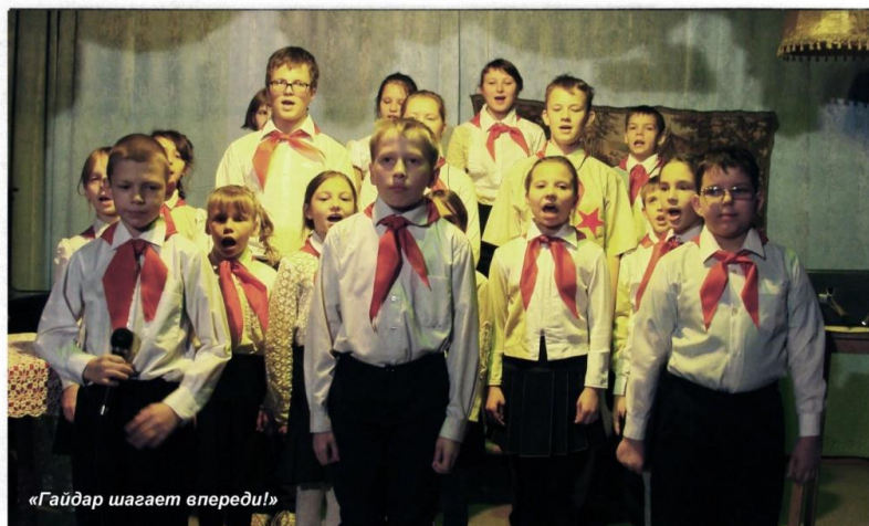
«Гайдар шагает вперёд!»

Познакомившись с биографией писателя по презентации слайдов, зрители окунулись в темпы и ритмы великих строев 30-х годов Советской страны, которые были показаны в виде символического танца под музыку из сюиты «Время, вперёд!» Г. Свиридова. В своё время именно эта музыкальная тема была позывным новостей на Центральном телевидении и на Первом канале.