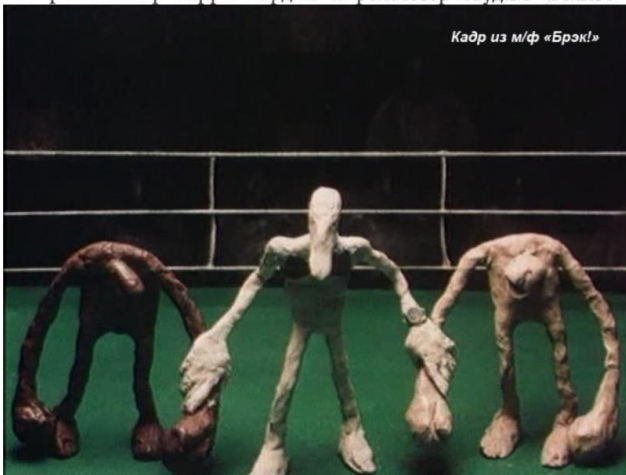
Кадр из м/ф «Брэк!»