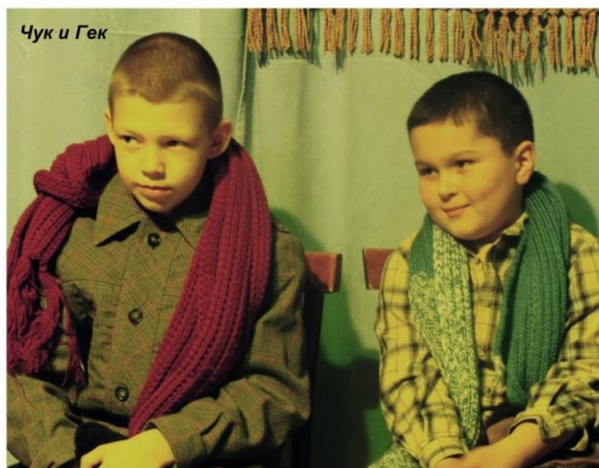
Чук и Гек