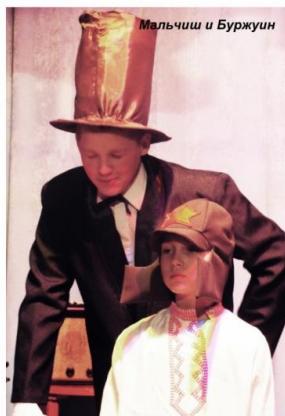
Мальчиш и Буржуин

В ожидании начала представления зрители с интересом рассматривали сцену, где была воспроизведена обстановка квартиры 30-х—40-х годов прошлого столетия. Гаснет свет. Световой луч высвечивает отдельные предметы, появляется ведущая, зажигает «зелёную» лампу, заводит патефон, и вслед за звуками спокойной музыки зрители отправляются в прошлое нашей страны.