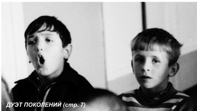
ДУЭТ ПОКОЛЕНИЙ (стр. 7)

Берегите друг друга. До скорой встречи!..