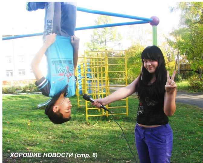
ХОРОШИЕ НОВОСТИ (стр. 8)