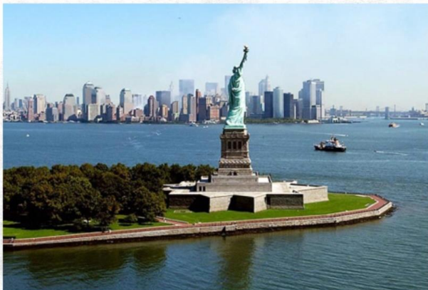
Статуя Свободы в Верхней Нью-Йоркской бухте

из страны, они надеялись на лучшую жизнь. Но не всё сложилось так, как хотелось. Видимо признаться себе, что надежды не оправдались, не хватает духу, поэтому проще клеймить бывшую Родину и превозносить мнимую американскую свободу. Тот, кто думает, что живёт хорошо, просто-напросто заблуждается, ибо пропаганда чрезвычайно сильна: американцы самые богатые, Америка – это рай... Люди верят в рекламу, так же как и в «права человека», которых попросту нет. Американцы не знают свою историю и даже не хотят её знать. Общаться там просто не с кем. Негры, которых там называют афроамериканцами, не любят белых, белые не любят негров и многих других. Поэтому все живут обособленно. А если ты ещё и не очень хорошо говоришь по-английски, то дело совсем плохо. На работу берут только с хорошим английским и при наличии документов. Поэтому вся работа в Америке делится на рабов и работодателей.