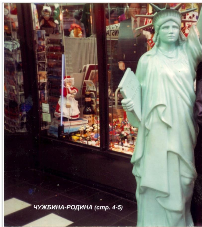
ЧУЖБИНА-РОДИНА (стр. 4-5)