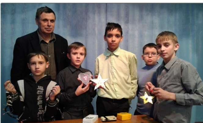
СЛАВНЫЕ ТРАДИЦИИ (стр. 6)