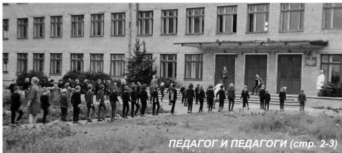
ПЕДАГОГ И ПЕДАГОГИ (стр. 2-3)