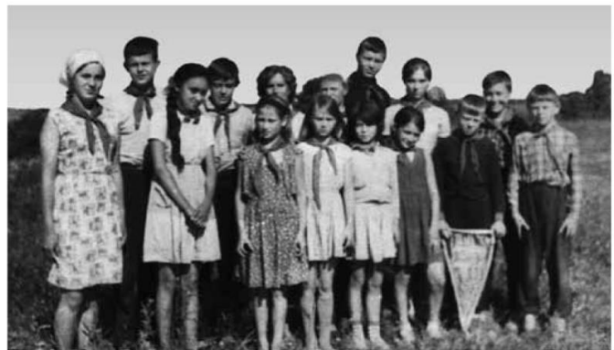
Лето '63 г. Школа-интернат еще не открыта