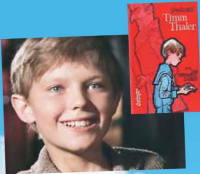
Не продавай свой смех! - стр. 7