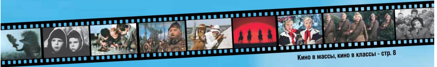
Кино в массы, кино в классы - стр. 8