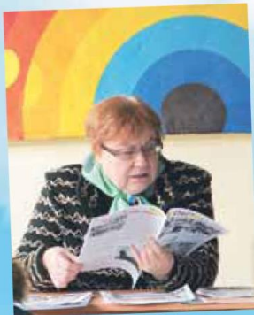
«Отрок» рвется в молодежь - стр. 4