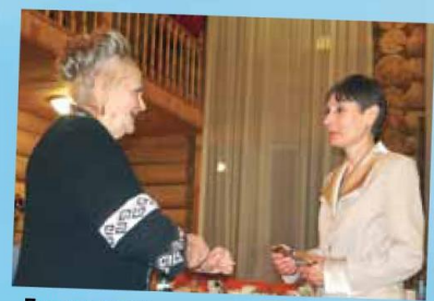
Лицом к лицу: учитель и ученик - стр. 2-3