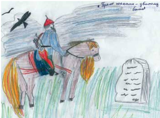
Рисунок четвероклассника к фильму «Илья Муромец»