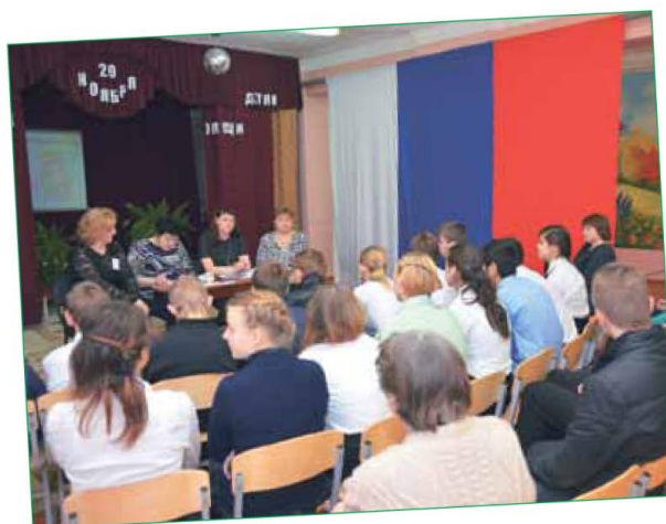
Права и обязанности - стр. 2