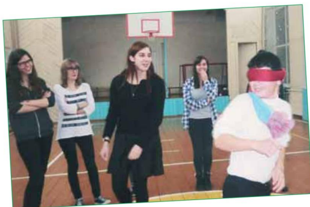
Вітвену - по-русски это... - стр. 3