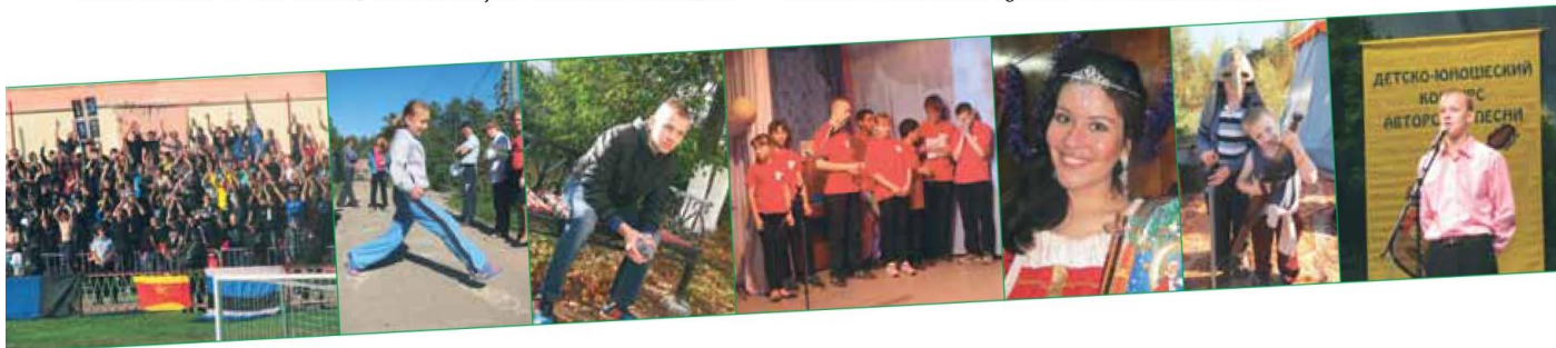
Разноцветный свистящий миг - стр. 6-8

любивый итог уходящего года. «Отрок» сдержал своё слово и встретился со своими читателями 10 раз. Впереди тайны новогодней ночи, подарок под ёлкой и тихое ожидание чуда... С Новым годом.