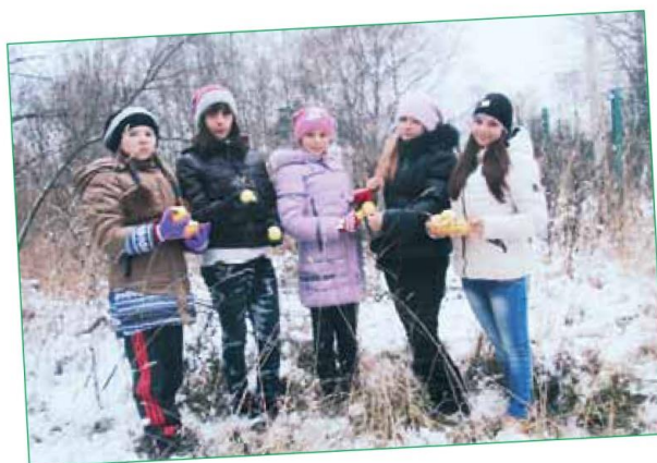
Кулинарный привет из лета - стр. 5