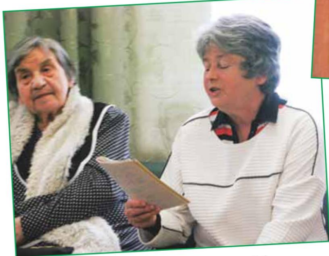
Литературная приглашает поэтов - стр. 6-7