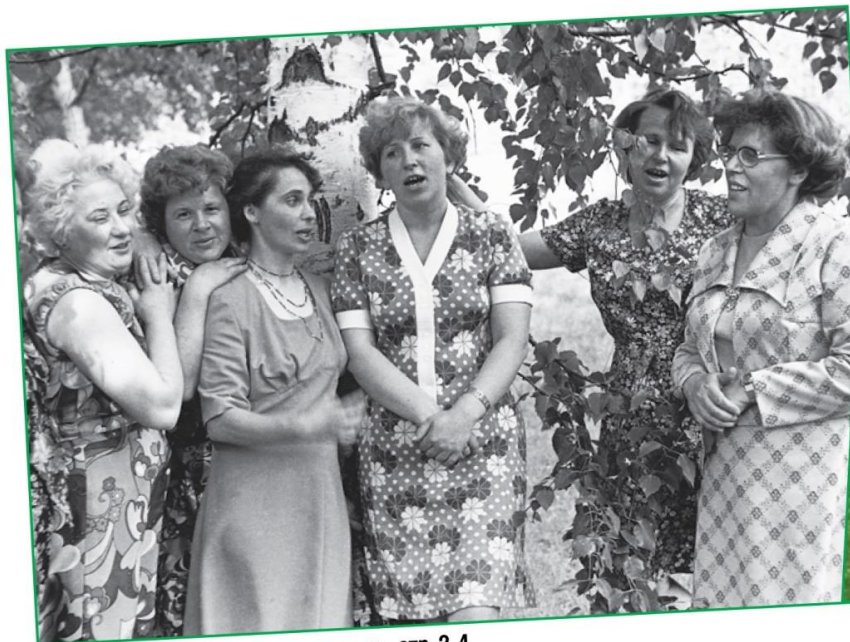
Лицом к лицу: Учителя и их ученики - стр. 2-4