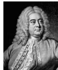
Г.Ф. Гендель (1685-1759)