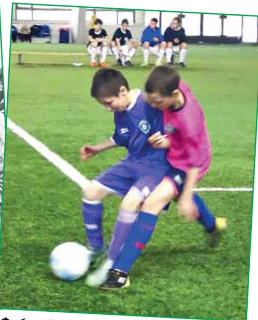
Футбол в Питере - стр. 8