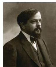
К. Дебюсси (1862-1918)