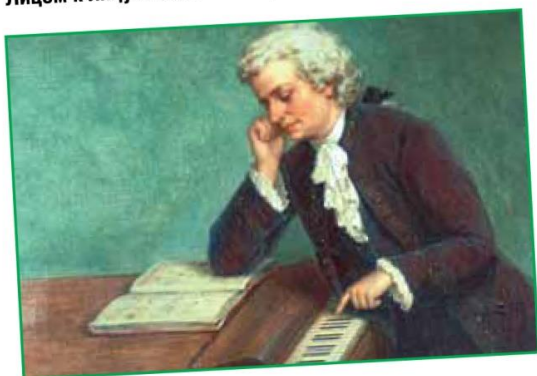
Музыка лечит - стр. 5-6