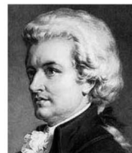
В.А. Моцарт (1756-1791)

Английский композитор и пианист С. Скотт (1879-1970) утверждал, что каждый специальный род музыки влия-