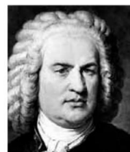
И.С. Бах (1685-1750)