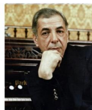
М. Таривердиев (1931-1996)