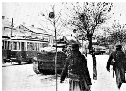
14 октября 1941 г., на улицах оккупированного Калинина

километров семьдесят. Тот дал указание завхозу выделить нам коня и тарантас 2 . Ехали мы рысью, чтобы не попасть в лапы немцам. В Курске нас сразу же отправили мыться в баню. В приёмном отделении меня осмотрели и сказали, что пуля не задела кишечник. Однако, мытьё наше было недолгим. На город налетели самолёты и стали бомбить.