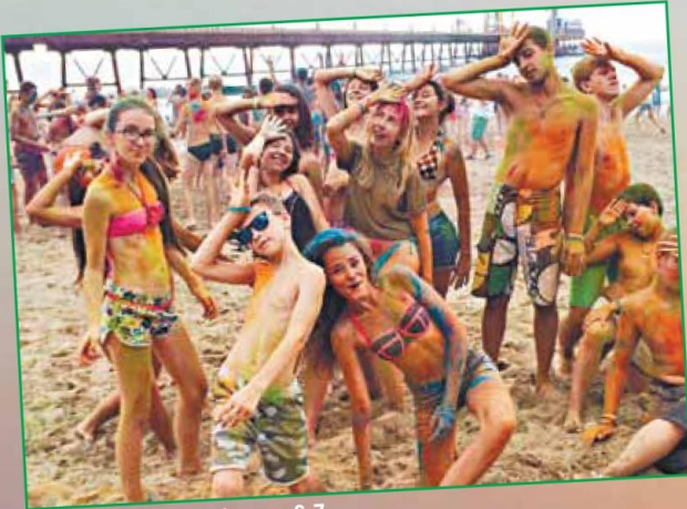
Орлянский флешмоб - стр. 6-7