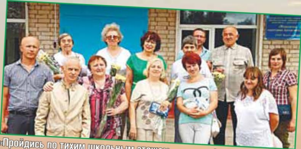
«Пройдись по тихим школьным этажам...» - стр. 4-5