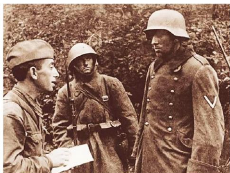
Младший лейтенант допрашивает пойманного немецкого разведчика

По выписке меня направили в Новосибирскую область в школу радистов. Она располагалась в ста километрах