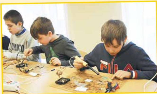
Электроника – занятие для настоящих мальчишек – стр. 6