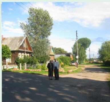
Именно родители и учителя делают из нас людей – стр. 2