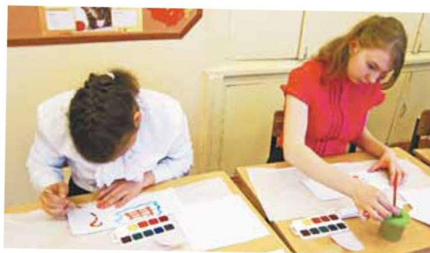
На связи Торжокская школа-интернат – стр. 4-5