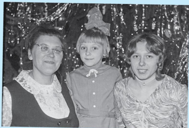
Пришли письма от выпускников 70-х – стр. 3