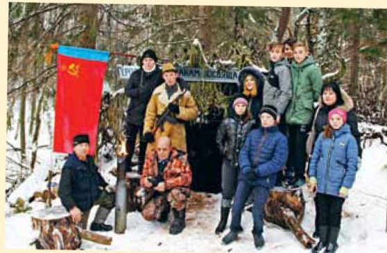
«Лучший выходной в моей жизни!» – стр. 6