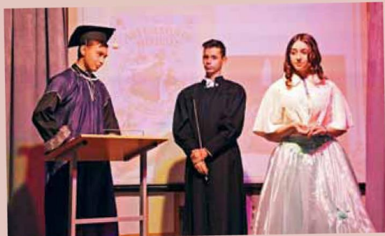
К 130-летию С. Маршака – стр. 6-7