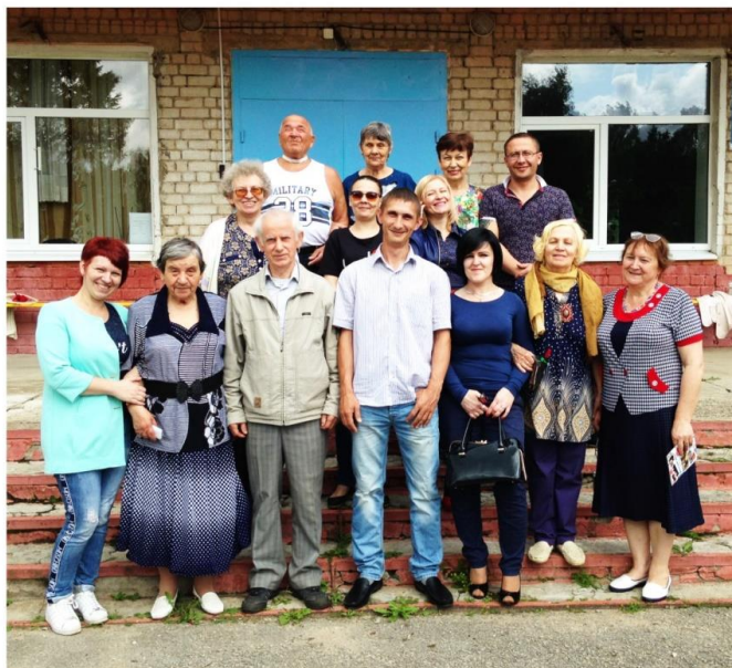
20 лет спустя

- После выпуска я подала заявление в Торжокский педагогический колледж, пришла на вступительные экзамены. По русскому языку – диктант, математика письменно. Помню, зашла в аудиторию на экзамен, а другие девочки спрашивают: «Кто соображает в мате-