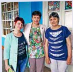
Поколения снова разговаривают – стр. 2-3