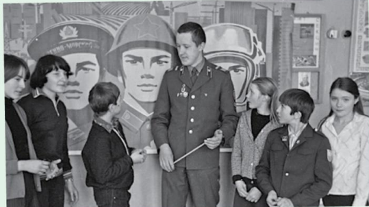
У нас в гостях воин! – стр. 4