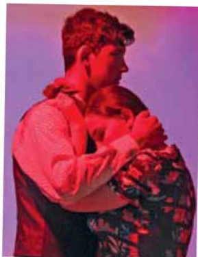
95-летию поэта посвящается – стр. 7-8