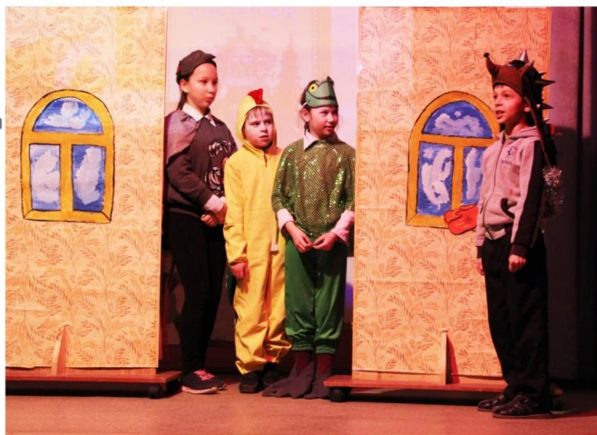
Кто, кто в теремочке живет?

На викторине из презентации слайдов ребята узнали больше подробностей из жизни и творчестве поэта. Они также проявили себя на сцене – классные руководители постарались вовлечь в инсценировки практически всех. Инсценируемые произведения раскрыли перед зрителями многогранный талант мастера: переводчика («Мельник, мальчик и осёл» (2 кл.), «Капля мёда» (5 кл.)), поэта («Весёлый счёт» (1 кл.), «Рассказ о неизвестном герое» (4 кл.)), сказочника («Теремок» (3 кл.), «Кошкин дом» (6 кл.), «Старуха, дверь закрой» (7 кл.)), драматурга («Двенадцать месяцев» (8 кл.)). Юные читатели могли показать знание произведений С.Я. Маршака, отвечая на вопросы