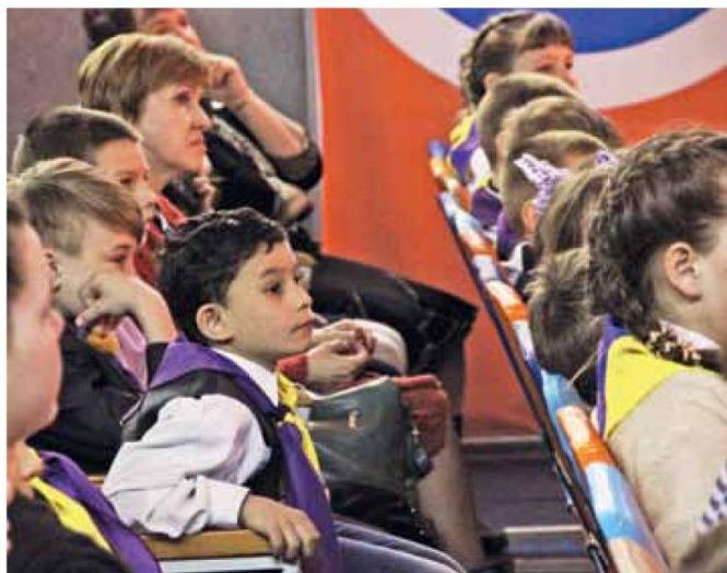
Зритель ждал этой встречи!..

- Очень дружеской атмосферой. Фестиваль очень душевный и приятный. Люди заражаются творческой