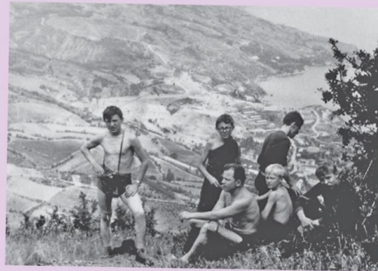
Вершина покорена – стр. 2-3