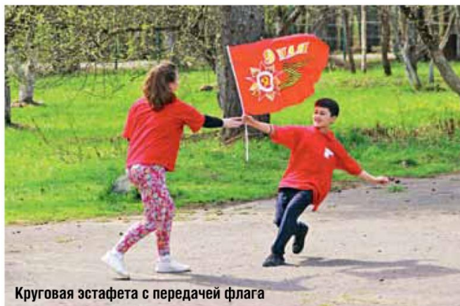
Круговая эстафета с передачей флага