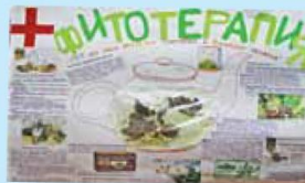
Забота о здоровье – стр. 13