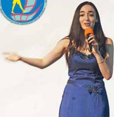
Детское кино – детям! – стр. 11-12