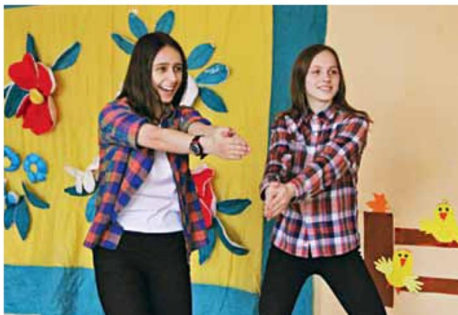
Идет тренинг по актерскому мастерству

атмосферой и вдохновляются на новые работы. Всё очень понравилось.