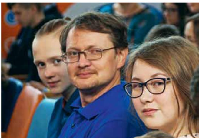
Делегация из г. Глазова (Удмуртия)