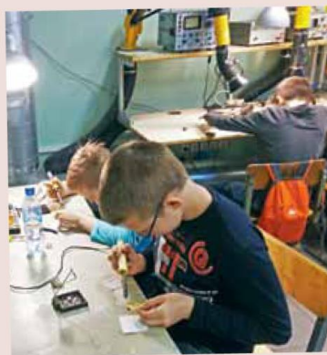
Обе столицы зовут радиотехников – стр. 6