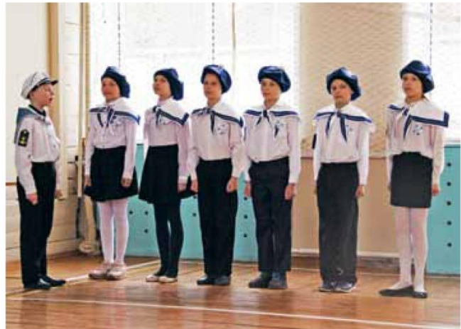
На первый-второй рассчитайся! (команда 4 класса)

Торжественной колонной строевым шагом участники покидают зал. Теперь можно дать волю эмоциям, ибо строевой устав требует большого напря-