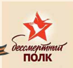
73-й годовщине Великой Победы посвящается – стр. 14-16