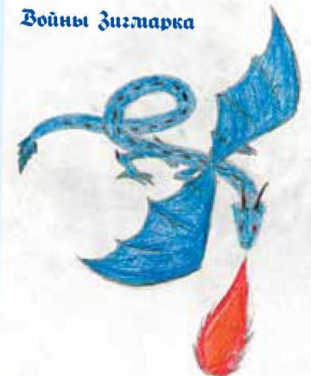
Разрежь и сложи. Получится продолжение книжки – стр. 7-10