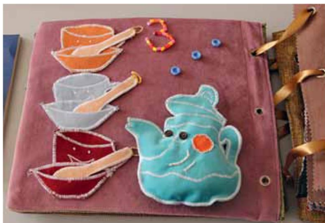
Страница цифры «3» тактильной книги

Сначала ребята и педагоги поехали Тверскую школу № 3 вручать свою тактильную книжку, в которую было вложено столько трудов и любви. Хозяйка радушно приняла гостей, показали школу, устроили мини-концерт, где читали стихотворения известных поэтов и собственного сочинения. После концерта началось общение. Медновцам было интересно, как слепые читают, пишут. Им не только это объяснили и показали, но и дали попробовать что-нибудь написать самим.