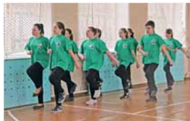
Песню запевай! (команда 6 класса)

Итак, в начальной школе III место занял 3 класс, II место – 2 класс. Победителями стали четвероклассники, и это их вторая победа. Среди старшеклассников III место занял 9 класс, на II месте 5 класс, а I место у шестиклассников. 6 класс ещё не знал горечи поражений, это их четвёртая победа!