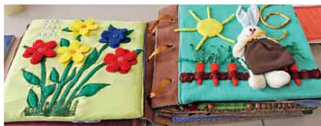
Страницы цифр «5» и «6» тактильной книги

Ребята активно отвечали на вопросы, вместе с автором рассуждали, что такое счастье и как за него бороться. Говорили о выборе пути, размышляли над выбором главного героя Петра и его второй половины Эвелины.