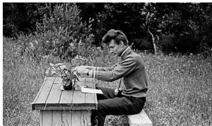
«Пятый Б, все сюда!»