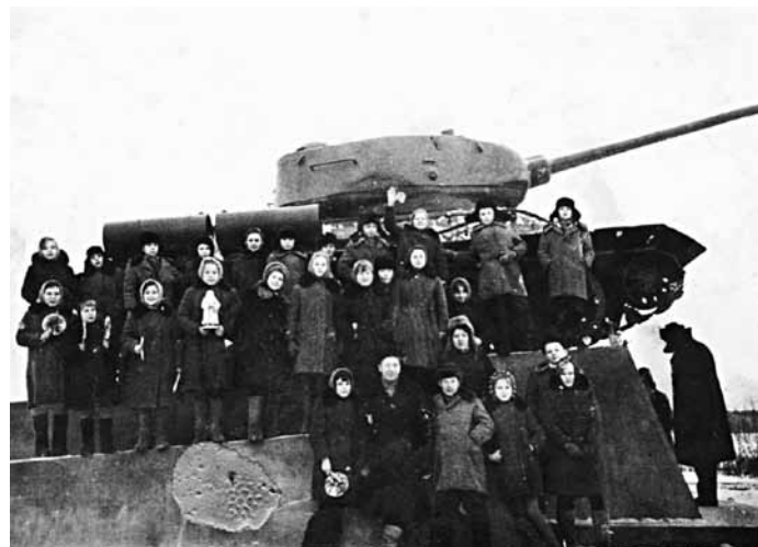
5Б и воспитатель А.В. Туманов

Был организован кукольный театр. Ставились спектакли по мотивам русских народных сказок. Недостающие кукольные персонажи ребята изготавливали сами из папье-маше, костюмы для них девочки шили на уроках труда. Рампу, кулисы помогал делать столяр