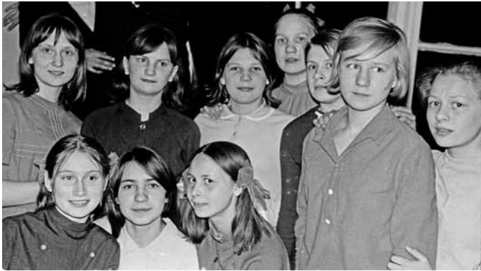
Галины подруги в школе-интернате