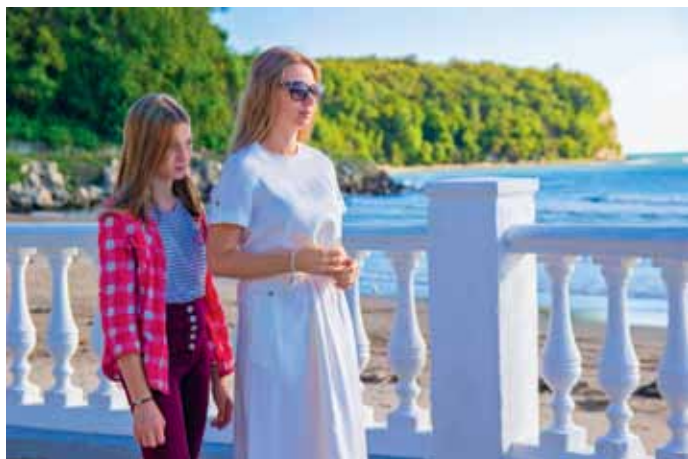
Снимается фильм «... И билет на самолёт»

Второй день заезда завершился старинной орлятской традицией «Поющая звездная площадь». Положив руки на плечи друг другу и тихонько покачиваясь, ребята пели вечернюю песню. В кругу каждый видит лица друзей, их глаза, ощущает дружеское плечо, поддержку и понимание. Смена началась... Ребята стали частью одной большой семьи, в которой тебя всегда поймут и где каждый сможет раскрыть свои таланты.