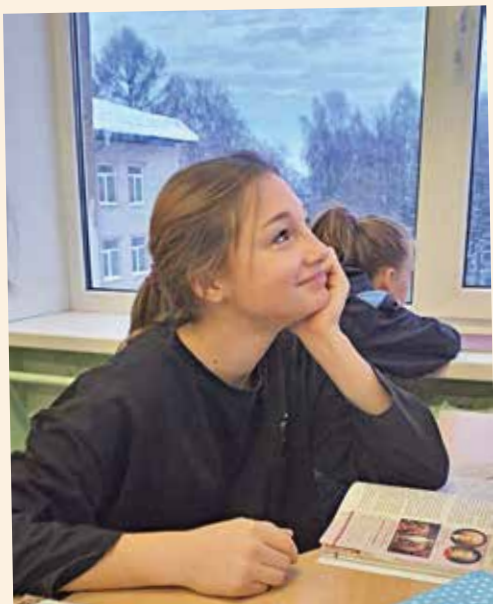
Улыбка радуги - стр. 16