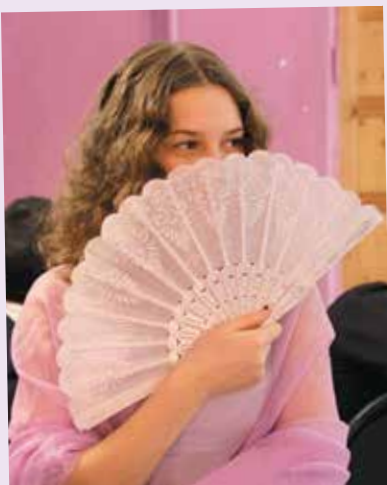
«Пушкин, Пушкин приехал!» - стр. 6-11