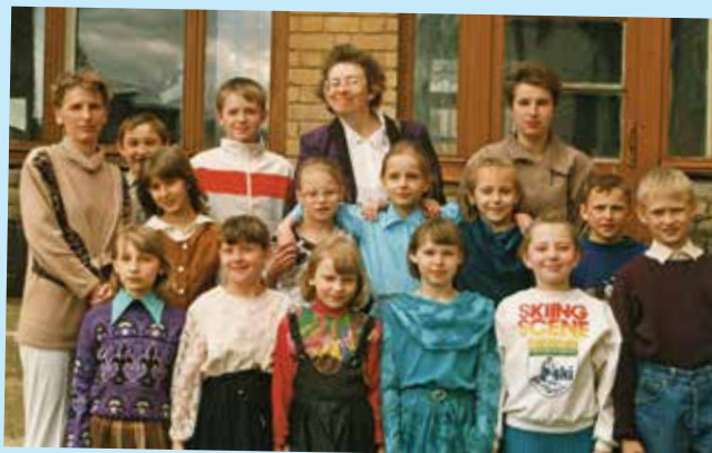
Выпускники говорят с выпускниками - стр. 5-6