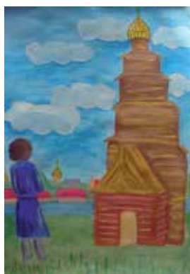
Пушкин в Торжке (Л. Григорьева, 7 кл.)