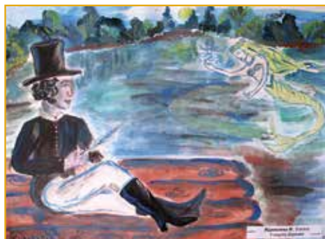
Берново. У омута (М. Журавлева, 9 кл.)