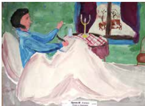
Утро в деревне (М. Орлов, 4 кл.)