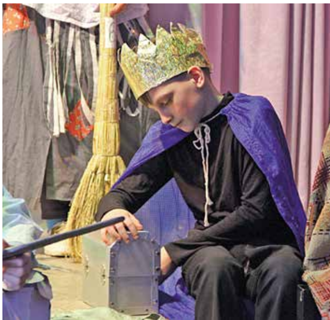
«Там царь Кашей над золотом чахнет...»