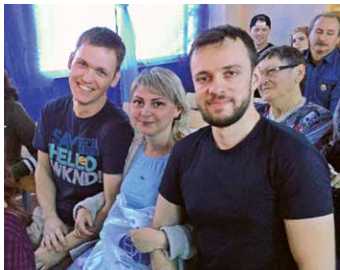
На праздновании юбилея школы-интерната (13 октября 2018 г.)