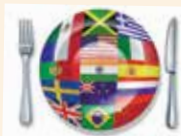
Кухня - место для экспериментов - стр. 8, 12-14