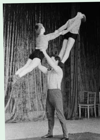
Маленькие исповеди о прошлом - стр. 2-4