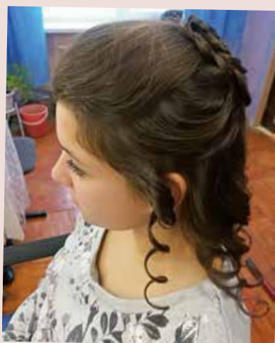
Школьный парикмахер и её кокетки - стр. 14-15