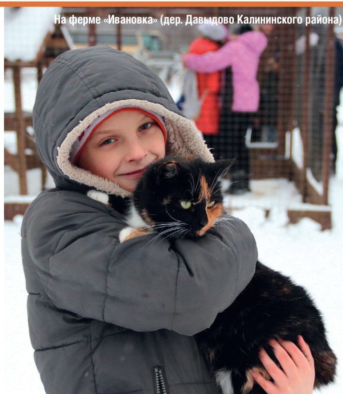
На ферме «Ивановка» (дер. Давыдово Калининского района)