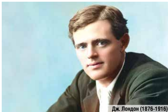
Дж. Лондон (1876-1916)