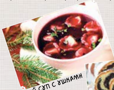
КРАСНЫЙ СУП С УШКАМИ