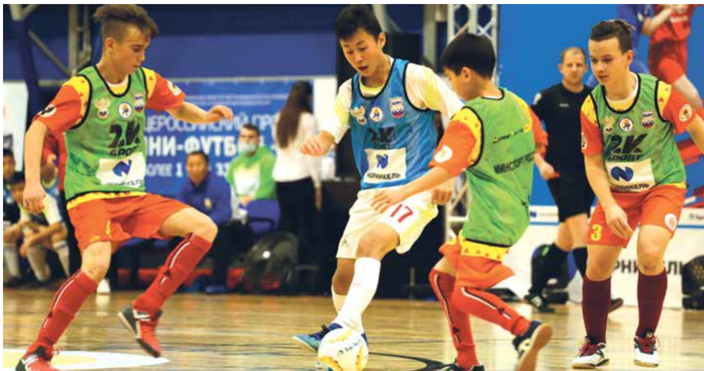
Напряжённый поединок с бурятскими футболистами в старшей возрастной группе