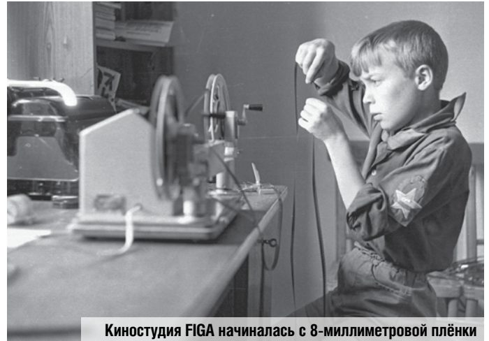
Киностудия FIGA начиналась с 8-миллиметровой плёнки

Да, в этой повести писатель рассказывает нам о детских мечтах своего героя Владьки и детстве таких же мальчишек. Действительно, ни разу не видел моря, главный герой мечтал построить настоящий корабль. Позже, став взрослым, Владислав осуществил свою мечту. В его жизни появились и «корабли», которые могли ходить под парусами, и команды матросов, состоящие из таких же, как он сам когда-то подростков. Сам