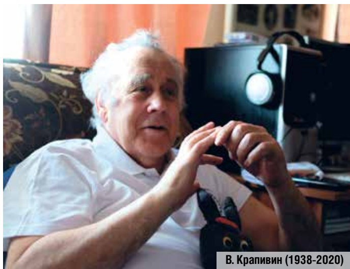
В. Крапивин (1938–2020)

Повесть «Тень Каравеллы» открывает целый мир детства и не просто детства, а взросления в очень