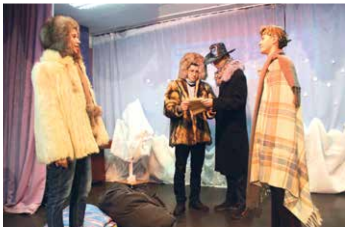
Инсценировки из рассказов «Смок Беллью» и «Любовь к жизни» →