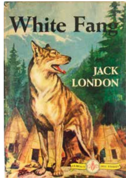
Обложка американского издания повести «Белый клык»

В повести «Зов предков» (1903 г.) огромный сенбернар Бэк оказывается в руках жестоких, корыстных хозяев, попадает на север и не погибает лишь потому, что на выручку ему приходят добрые и мужественные люди. Он успел стать почтовой собакой и вожакom в собачьей упряжке, где не раз показывал свой ум. Бэк жил с человеком, но всё чаще пропадал в лесу. Его тянула туда непреодолимая сила. В конце концов, Бэк выбирает для жизни дикую природу, он уходит на зов предков.