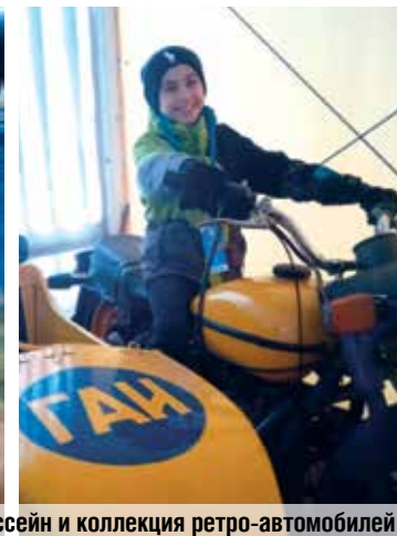
На базе отдыха есть бассейн и коллекция ретро-автомобилей