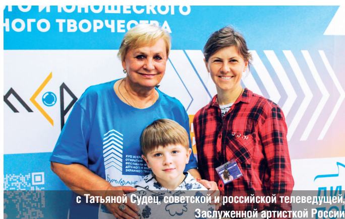
с Татьяной Судец, советской и российской телеведущей, Заслуженной артисткой России