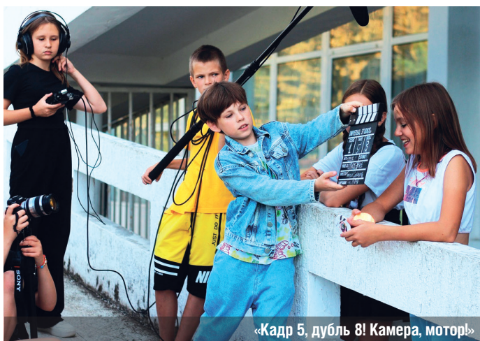
«Кадр 5, дубль 8! Камера, мотор!»

В этом году создаваемые за время смены фильмы должны быть экранизациями каких-нибудь литературных произведений. Наша команда решила снять два фильма: «День послушания» по рассказу К. Драгунской и «Лёгкие деньги» по рассказу Т. Мирошник. Самое страшное, что у нас было только три дня на съёмки и монтаж. Но «невозможное возможно», как поётся в песне, и мы это сделали!..