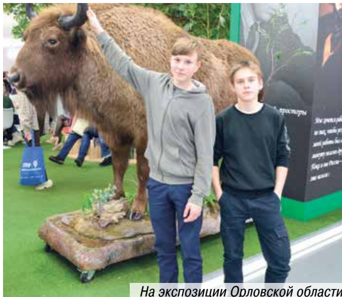
На экспозиции Орловской области