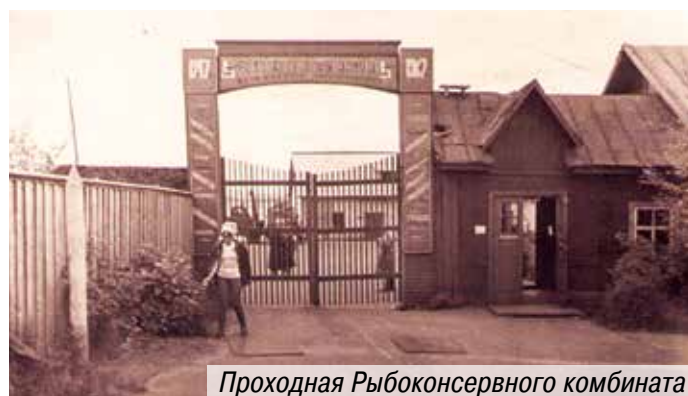
Проходная Рыбоконсервного комбината

Сначала мастер рассказал о том, что производит