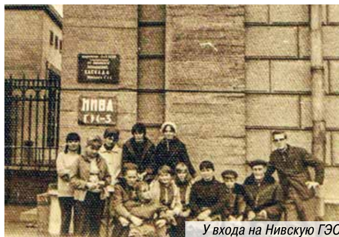
У входа на Нивскую ГЭС

По договору с инженерами мы побывали на Нивской ГЭС. Это подземная электростанция мощностью 154 МВт. Конечно, это намного меньше Братской ГЭС, но на Кольском полуострове она является довольно крупной электростанцией.