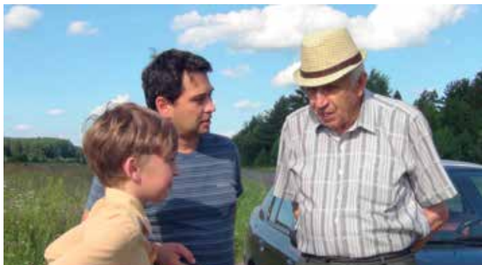
По местам военного детства: съемки фильма в д. Козино